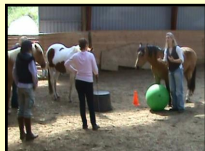
Hesten som underviser

HorseFriendShip® har en stor indvirkning på menneskers opfattelse af dem selv.