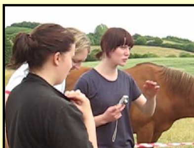
Feedback med oplevelsen