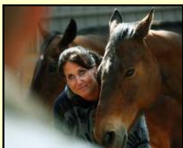
Lytte til observationer

Forståelse • Løsninger • Aha momenter • Respect • Succes